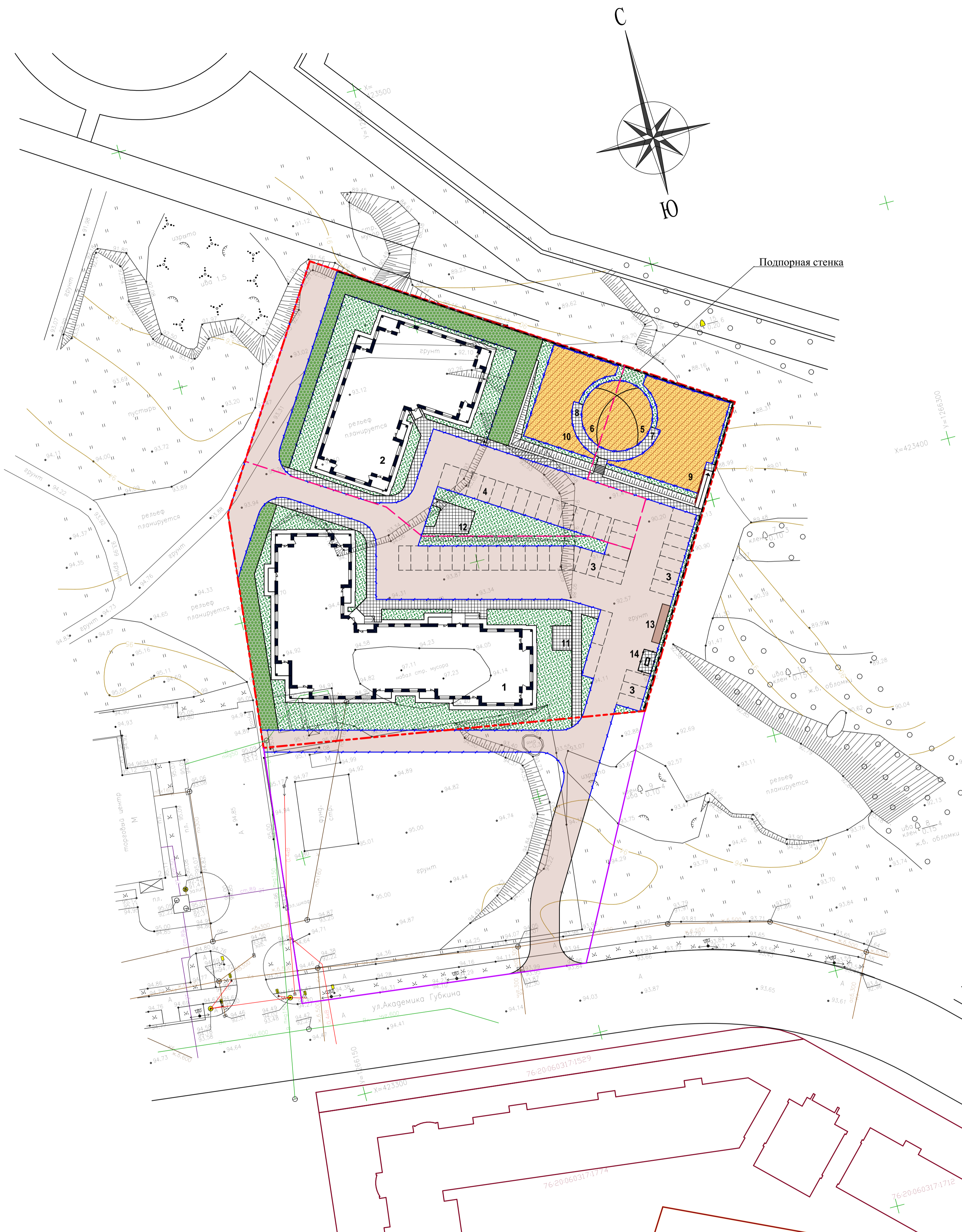
Расстановка малых форм архитектуры на детской, физкультурной площадках и площадке для отдыха